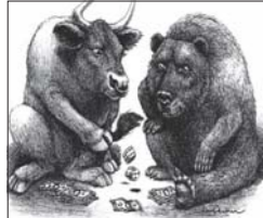
BULL & BEAR

നടപ്പുസാമ്പത്തിക വർഷം ഇന്ത്യയിലെ പൊതു മേഖലാ സ്ഥാപനങ്ങളും സ്വകാര്യ കമ്പനികളും ചേർന്ന് ലക്ഷ്യമിടുന്നത് 1.2 ലക്ഷം കോടി രൂപയുടെ പ്രാരംഭ ഓഹരി വിൽപനയാണ്. ബിസിനസ് വികസിപ്പിക്കുന്നതിനുള്ള പണം സമാഹരിക്കുന്നതിന് ഇത്രയേറെ ഓഹരികൾ പുറത്തിറക്കുന്നത് സാമ്പത്തിക മേഖലയ്ക്ക് ഏറെ ഗുണകരമാകുമെന്നാണ് വിലയിരുത്തുന്നത്. കേന്ദ്രസർക്കാർമാത്രം പൊതു മേഖലാസ്ഥാപനങ്ങളുടെ ഓഹരി വിൽപന വഴി 40,000 കോടി രൂപ സമാഹരിക്കാനാണ് ലക്ഷ്യമിടുന്നത്.